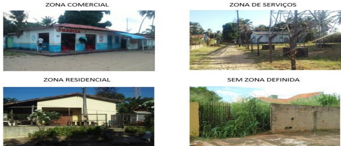
Fig. 2 – Classes de uso e ocupação do solo utilizadas no zoneamento dos lotes da Vila de Algodual

A APA de Algodual-Maiandeuá pode ser acessada pelo Município de Marapanim ou pelo