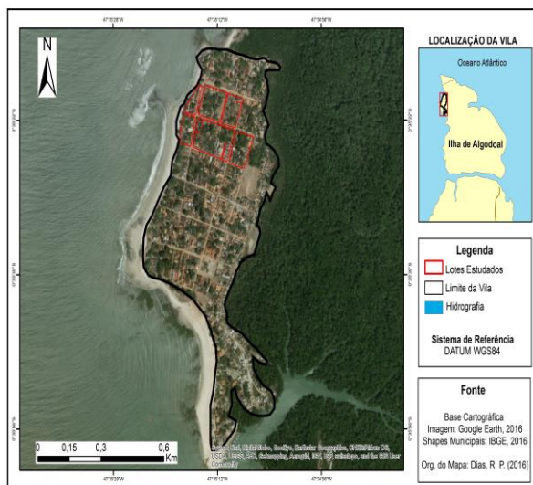
Fig. 1 – Localização dos lotes dentro da Vila de Algodual no município de Maracanã - PA

A localização da área de estudo, situa-se no litoral nordeste do Estado do Pará, na microrregião do Salgado, e confronta-se com: o Oceano Atlântico ao Norte, o Furo do Mocooca ao Sul, a ria de Maracanã e a Reserva Extrativista Marinha de Maracanã a Leste, bem como a ria de Marapanim a Oeste. Está situada entre as coordenadas geográficas extremas - Ponto Norte: 47°35'18,651" W e 0°34'32,535" S; Ponto Sul: 47°32'25,590" W e 0°38'14,998" S; Ponto Leste: 47°31'51,954" W e 0°36'56,626" S; e Ponto Oeste: 47°35'28,826" W e 0°35'36,299" S (SEMA, 2012), como pode-se observar no mapa.