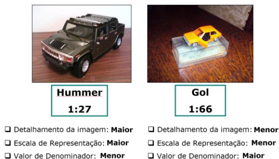
FIG. 2. A escala de representação em miniaturas.

Num segundo passo, estabelece-se a relação: quanto menor o valor do denominador da fração (27), maiores serão os detalhes da miniatura (Hummer), bem como maior será a escala de representação.