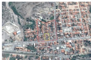
Fig. 1- Imagem da região em estudo.

Localiza-se no município de Itatim-Ba, cuja posição geográfica é 12^{\circ} 42' 49'' S e 39^{\circ} 41' 36'' W, no Estado da Bahia, na Rua José Vieira Gomes onde faz ligação com a BA-493. O município se estende por 583,4 \text{ km}^2 e conta com uma população de 14539 habitantes. A área todo compreendida, foi realizado tanto o levantamento terrestre (método do alinhamento), quanto o levantamento com drone, onde foi escolhido uma quadra da região em estudo, para fazer uma análise dos resultados obtidos pelos dois levantamentos (Figura 1).