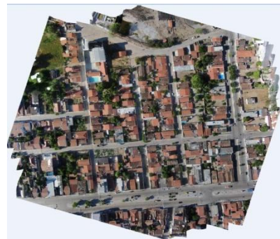
Fig.2- Imagem da ortofoto

mosaico gerado a partir do processamento das imagens. Por meio do aplicativo DSG Tools, gerou-se um banco de dados que correspondiam as classes ET-EDGV, necessário para fazer a vetorização. Logo abaixo a figura 2 (imagem da ortofoto) e a figura 3 ( mapa obtido pelo processo de vetorização).