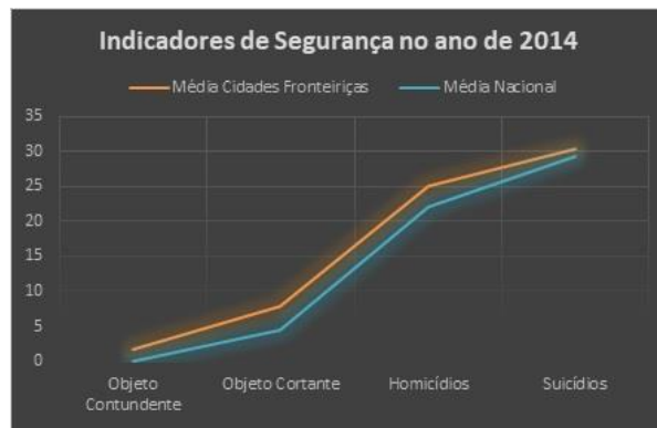
Figura 1 – Gráfico referente aos indicadores de segurança no ano de 2014 das cidades fronteiriças com relação à média nacional, considerados pelo número de ocorrências por 100.000 habitantes (x/100.000 hab).

O gráfico, gerado com informações disponibilizadas pelo Instituto de Desenvolvimento Econômico e Social de Fronteira (IDESF), contém o comparativo dos Índices de Segurança (2014) dos municípios limítrofes da Amazônia legal com relação à média nacional. Objetos Contundentes, objetos Cortantes, Homicídios e suicídios serviram como indicadores dos motivos que levam à maioria dos óbitos a cada cem mil habitantes encontrados nestas regiões.