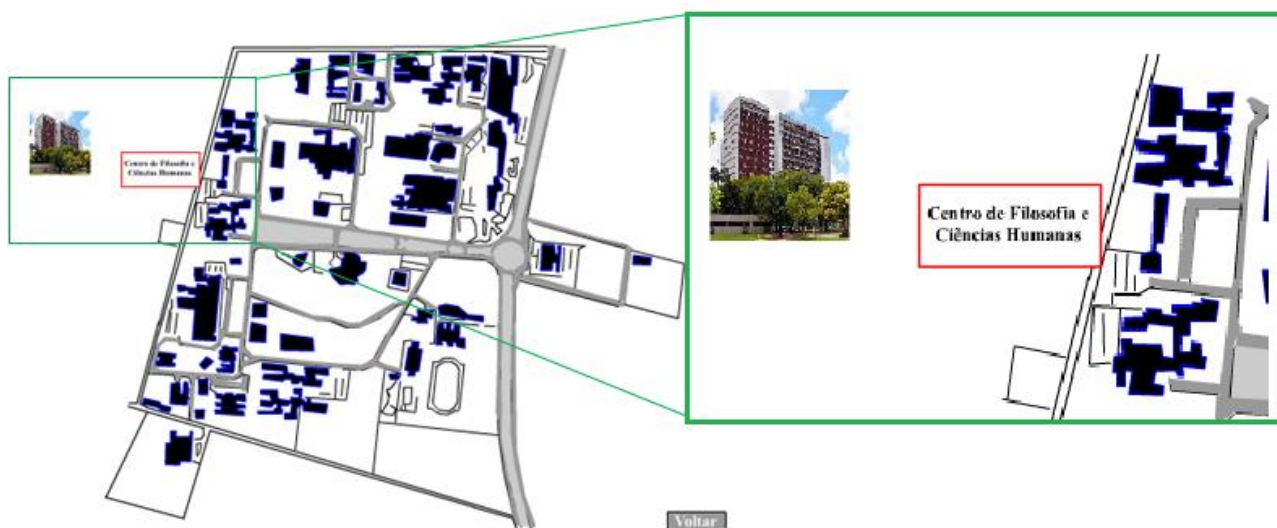
Fig. 2 – Mapa Flash

Diante do exposto, concluiu-se que os resultados apresentados mostraram-se satisfatórios e deram embasamento à utilização de metodologias e do programa supracitado no que tange à elaboração de mapa flash.