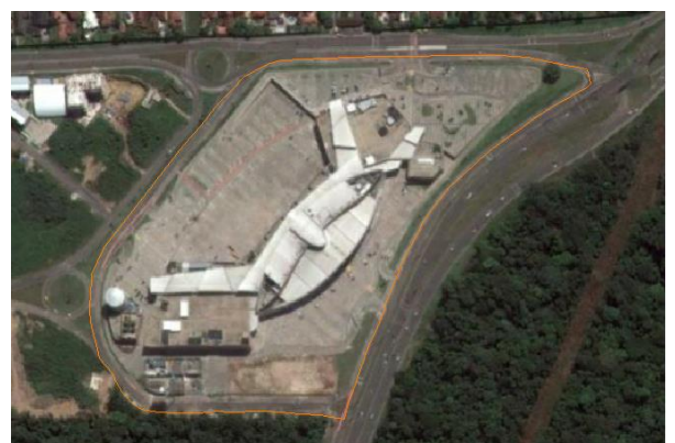
Figura 3: Área do Shopping Bosque Grão Pará em 2016.

A mudança no entorno e neste local pode ser percebida com a figura 3, quando o shopping já havia sido construído no ano de 2016, percebe-se que a área não modificou apenas com a construção do shopping mas também com a abertura da Avenida Centenário, por onde o shopping possui acesso também.