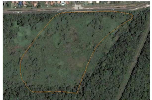
Fig. 2: Área onde foi construído o shopping em 2006.

A partir dos dados inseridos no cad foi possível observar a mudança na área onde foi construído o shopping, a figura 2 nos mostra como era a área em 2006, 9 anos antes da inauguração do shopping.