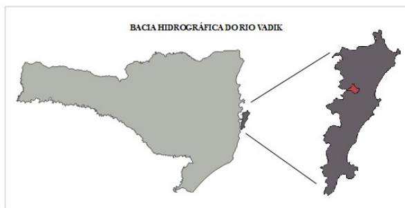
Fig. 1- Área de Estudos

A área de estudos é a Bacia Hidrográfica do Rio Vadik, localizada na Ilha de Santa Catarina – Florianópolis/SC, conforme apresentada na Figura 1.