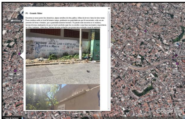
Figura 3: Plotagem no Google Earth com imagem e descrição do ponto.

O mapa confeccionado teve como finalidade primeira a espacialização dos impactos ambientais de acordo com as respectivas regiões.