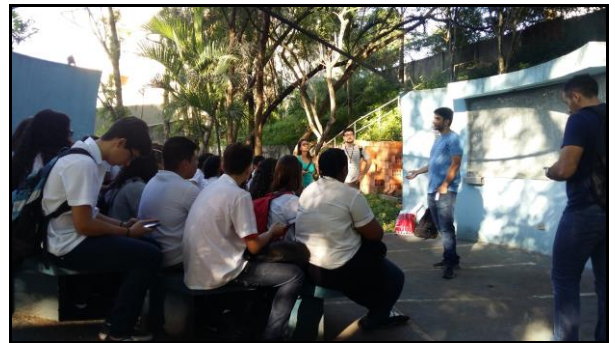
Figura 2: Orientações de Cartografia Básica e uso do aplicativo.

Em seguida, uma vez apresentados aos alunos, os aplicativos foram configurados para coordenada UTM devido à maior praticidade para plotagem dos pontos em softwares da plataforma GIS. Esta etapa encontra-se representada pela figura 2.