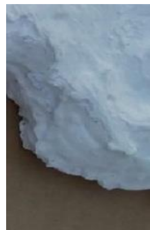
Figura 3: Cobertura de massa corrida

Para suavizar as formas é feita a cobertura das camadas com massa corrida, que depois de seca, é lixada. Essa etapa pode ser repetida várias vezes até que se obtenha uma maquete que apresenta as formas do relevo mais próximas da realidade, considerando a escala escolhida. Em relação a escala, no caso das maquetes é fundamental a definição da escala vertical, já que a horizontal é definida na base. Se o exagero vertical for muito acentuado as formas do relevo serão muito destacadas o que pode resultar em erros de interpretação. Serras e vales suaves podem se transformar em altas montanhas e cânions. Dessa forma é necessário que o intervalo entre a curva de nível mais baixa e a mais alta sejam observados, além da concentração de curvas em determinados pontos da maquete, neste trabalho foram utilizadas placas de isopor de 0,5 cm de espessura.