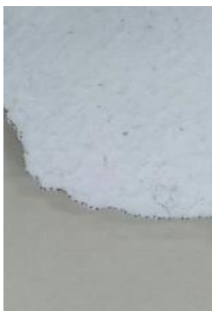
Figura 2: Corte das curvas de nível

Cada curva é cortada e posteriormente sobreposta e fixada com cola branca ou cola EVA específica para esse material. O resultado é o relevo representado em “degraus” que reproduz em terceira dimensão cada curva de nível.