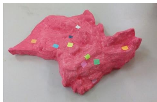
Figura 4: Produto final

Existem materiais menos agressivos para o meio ambiente do que o isopor, porém este foi escolhido pelos pesquisadores para agilizar a aplicação da atividade em sala de aula, os autores que trabalham com técnicas de construção de maquete como Simielli (1991) e Sena (2008) sugerem outros materiais como papelão, EVA, madeira balsa, caso sejam construídas várias maquetes pelos próprios estudantes. O acabamento foi feito com tinta guache, utilizando uma única cor pois o objetivo é dar destaque aos pontos que identificam a sede de cada time de futebol escolhido.