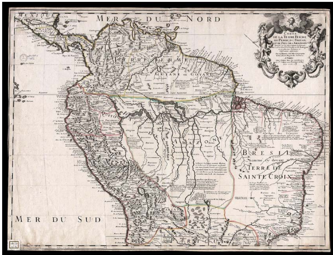
Figura 2 - Carte de la Terre Ferme, du Perou, du Brésil et du Pays des Amazones, de Guillaume de L'Isle, 1716.

Pedro Teixeira foi também o primeiro europeu a fazer o trajeto terrestre de Belém até São Luís, até então desconhecida dos portugueses. Essa rota era estratégica para garantir a comunicação entre as capitânicas do Maranhão e do Grão-Pará, caso o caminho marítimo estivesse bloqueado.